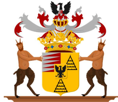
Familiewapen Sweerts de Landas

In 1814 werd het geslacht Sweerts de Landas, dat vele generaties in Staatse dienst geweest was, met 500 leden van andere families opgenomen in de begeerlijke adelstand van het nieuwe Koninkrijk der Nederlanden. Zij pretendeerden echter al ver voor die tijd dat ze van adel waren en voerden de titel van baron.