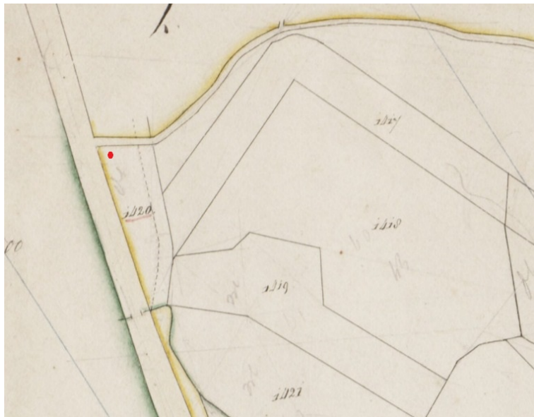
Plaats delict aan de Oude Grintweg in 1838. Rond 1884 kreeg de Oude Grintweg zijn huidige traject en buigt nu ter hoogte van het huidige herdenkingskruis iets naar rechts.

Op 5 oktober 1839 houdt de Hoge Raad een algemene vergadering, waarin wordt overwogen de koning, hoe ernstig de misdrijven ook zijn en hoe zorgvuldig de uitspraken van de gerechtshoven tot stand zijn gekomen, de gevoelens van de Hoge Raad kenbaar te maken en de koning op de jeugdige leeftijd van de misdadiger te wijzen. Het hardnekkig ontkennen van de misdaden, zelfs in het gratieverzoek, vindt de Hoge Raad stuitend, hetgeen in onderstaand advies aan de koning tot uiting wordt gebracht.