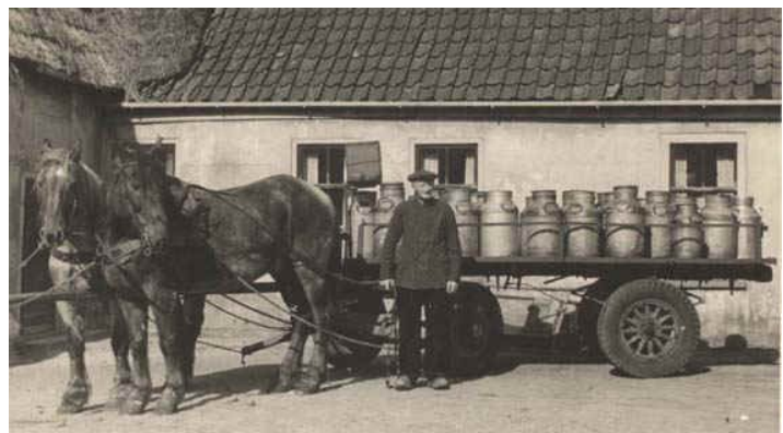
De Rommekar ofwel de melkkar

De Oirschotse melkfabriek ook wel boterfabriek genoemd stond op de hoek Gasthuisstraat/Oude Grintweg. Daar werden de bussen op een rollerband gezet en gingen zo de melkfabriek in. Bij binnenkomst van de melkbus werd het nummer van de melkbus genoteerd, zodat je wist van wie die was. De bus werd gewogen, het vetgehalte gecontroleerd en genoteerd en gelegeerd in een gigantische grote bak. Want op basis van het vetgehalte en de hoeveelheid geleverde melk werd betaald. Als de