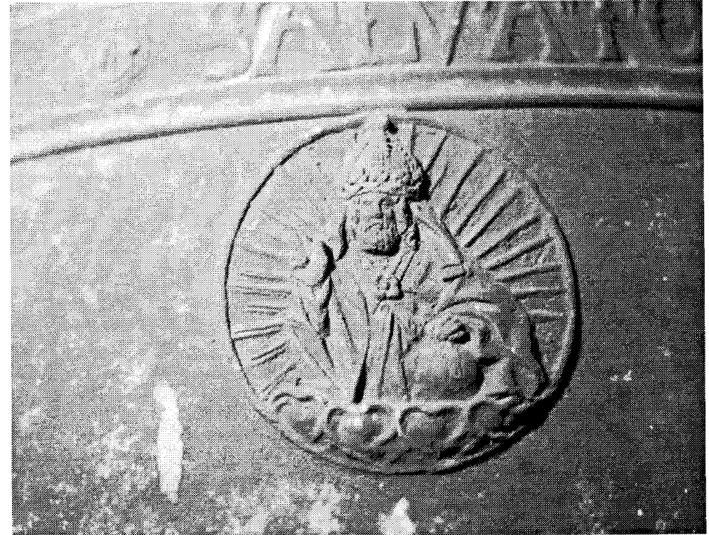
Afbeelding 3. Palquette met de toepasselijke voorstelling van Christus als Verlosser van de wereld, omdat de klok 'Salvator Mundi' (=Verlosser van de wereld) heet. (foto: Jacq. Rijnen, november 1996)

Massa klok: circa 510 2 kg; diameter onderzijde 94 cm; hoogte klok met kroon: 87 cm; hoogte kroon: 13 cm; aantal armen van de kroon: zes. Deze armen tonen aan de buitenzijde een decoratie (voorstelling is niet duidelijk en waarschijnlijk ook niet allemaal hetzelfde).