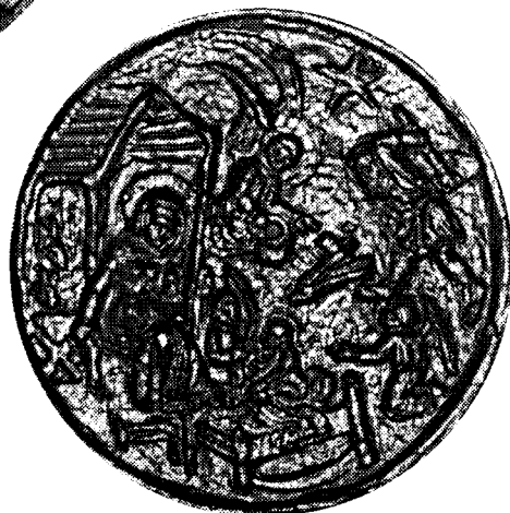
Afbeelding 5. Replica van de afbeelding op de klok uit Baarle-Hertog. (foto: Jacq. Rijnen, november 1996)

de klok van Beersel luidt, vrij vertaald uit het Frans: diameter 11,5 cm, voorstellende het huis van Nazareth, op de voorgrond, links, ziet men het huis waarvan het dak zich profileert, waarbij de H. Maagd is gezeten; aan haar voeten speelt het kindje Jezus, wiens hoofd een nimbus draagt, op een bedje met twee engelen ernaast; op de achtergrond, rechts, St. Jozef die niet een grote bijl hout aan het kloven is terwijl voor hem een engel zich klaarmaakt om een pot op het vuur te zetten. (Zie: Van Doorslaer: 1910(a), p. 159; 1910(b), p. 253; de hier bedoelde afbeelding staat in beide publicaties en is gedrukt met hetzelfde cliché.)