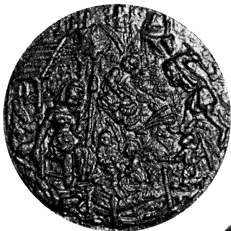
Afbeelding 4. Reliëf voorstellende de H. Familie. Bovenaan kijkt God de Vader toe. (foto: Jacq. Bijnen, december 1996)

ad 3. Diameter 102 mm. Eenzelfde voorstelling is te zien op de klok, in 1696 gegoten voor Beersel-op-den-Berg, door Jan van den Ghein, achterachterkleinkind van Peeter, de gieter van de klok uit 1551 4 ). Een beschrijving, met afbeelding, van