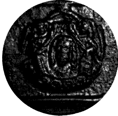
Afbeelding 2. Voorstelling van de Veronica-doek, opgehouden door twee engelen. Met dit medaillon wordt het begin van de rondgaande tekst aangegeven. (foto: Jacq. Rijnen, december 1996)

De woorden van de tekst zijn gescheiden (*) door een lelieornament. De begintekst wordt aangegeven (#) met een medaillon, diameter 29 mm, voorstellende een Vera-icoon) ofwel de Doek van Veronica (toont het ware gelaat van Christus), aan weerszijden opgehouden door staande engelen (zie afbeelding 2). Breedte tekststrand, gemeten tussen de ringen, 31 mm, hoogte letters 26 mm.