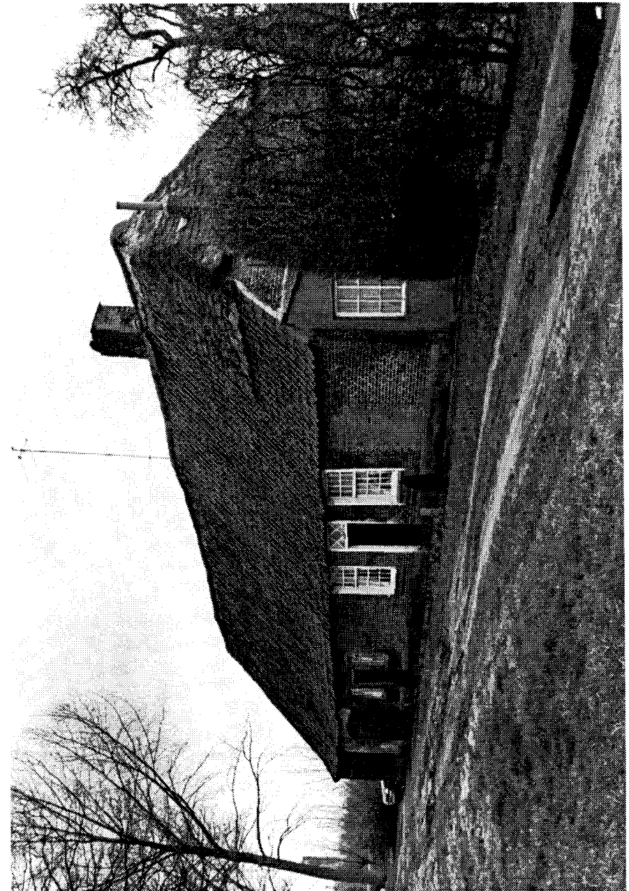
Fluterel 1, situatie 1983