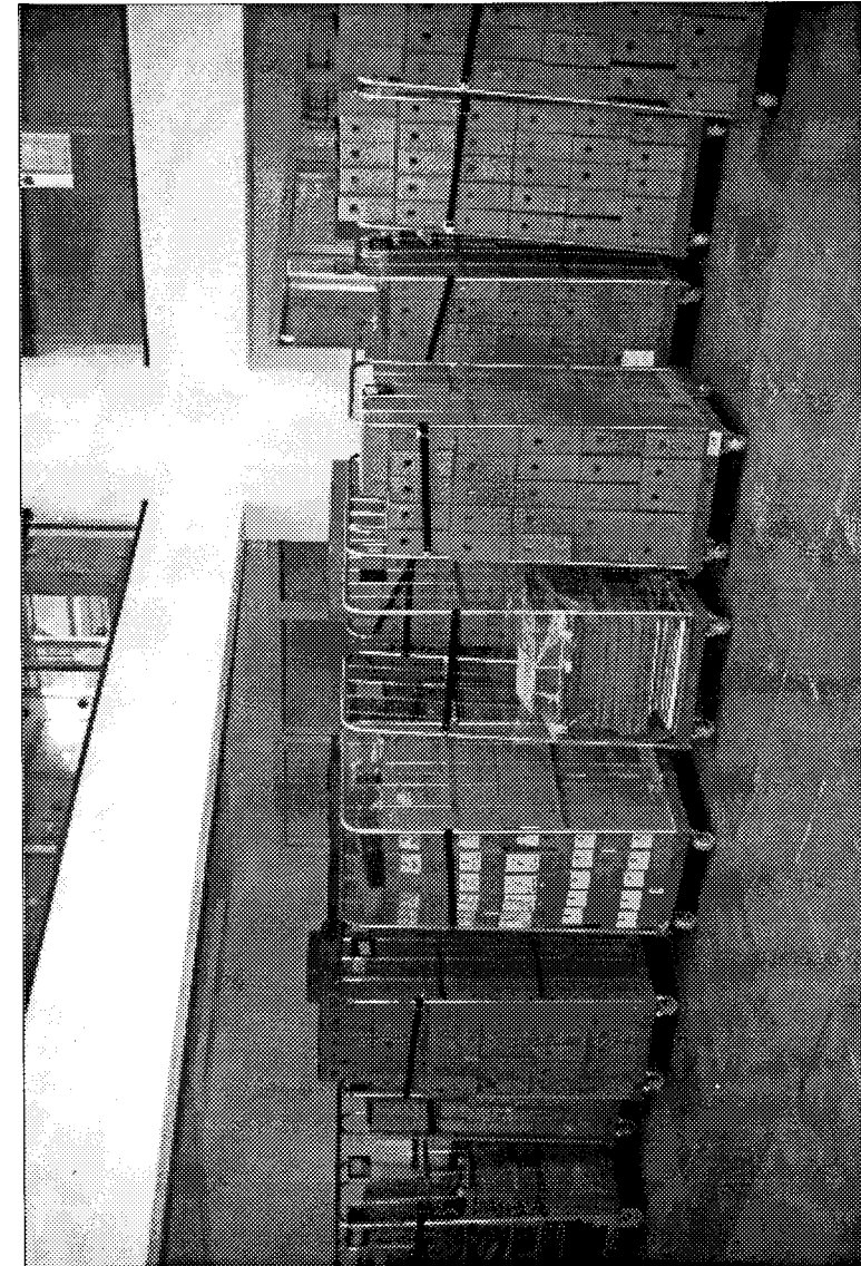
Tijdens de verhuizing: rolcontainers met archiefdozen

Eind februari jl. begonnen de werkzaamheden, terwijl inmiddels ook begonnen was met de voorbereiding van de verhuizing van de ca. 700 m' archivalia, boeken, restauratieapparatuur en kantoorinventaris. In het archiefdepot kwam ruimte om