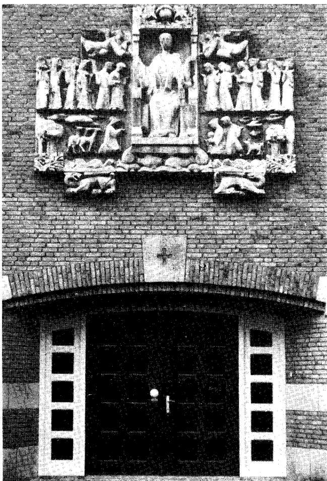
Afbeelding van het H. Hartbeeld boven de ingang van het voormalig klooster. Dit bleef in 1944 eveneens gespaard.

Bosch en diens vrouw. In die „pop" gingen wel eens muizen huisvesting zoeken. Bovendien werd er nog wel eens mee gespot. Vandaar dat het oorspronkelijke beeld toch weer werd teruggeplaatst. Het werd vaak bezocht door leerlingen, vooral in de examenperiode. Bij de ontruiming van Koningshof in 1978-'79, werden de ramen van de kapel meegenomen. Het Mariabeeld bleek bijna geheel te zijn verveerd. Het was niet weerbestendig en kon helaas niet worden gehouden. 1)