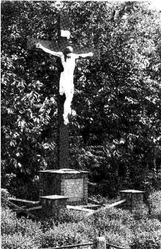
WEGKRUIS HOEK DORPSTRAAT - GENDERSTRAAT, VELDHOVEN

De opgenomen foto's zijn door de schrijver gemaakt.