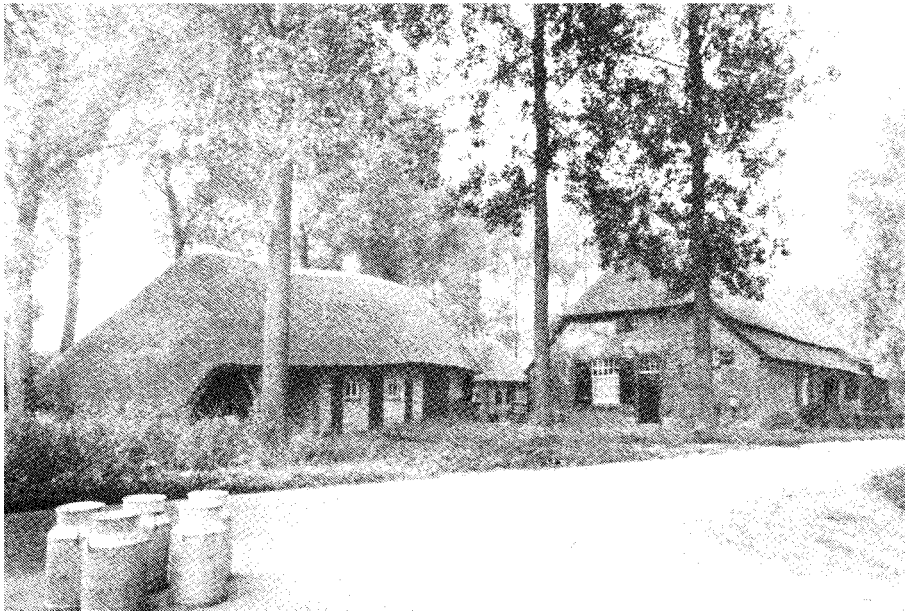
Liempdsedijk 3, Oirschot. 1978.

De lijst van onroerende monumenten van de gemeente Oirschot beschrijft dit perceel als volgt: „Boerderij van het Noordbrabantse langgeveltype, gedeeltelijk bedekt met riet. Haaks daarop gebouwd een geheel met riet bedekte veldschuur en bakhuis.”