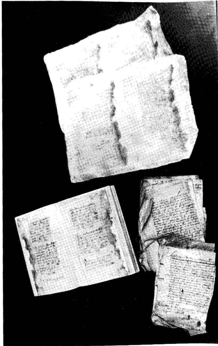
Drie fasen: beschadigde archiefstukken (rechts onder), aangevezelde stukken (boven) en het geheel gerestaureerde register (links onder).

werd in de beginperiode dat het restauratieatelier op het streekarchief functioneerde met succes toegepast.